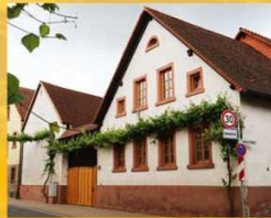
Siggie Konietzka Weinstrasse 15