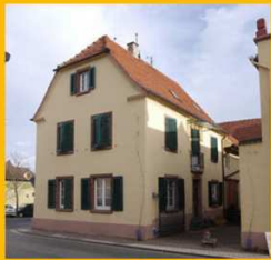
Weingut Bengel Weinstr. 22