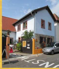
Tonhaus Segger & Huppertz Leininger Ring 85