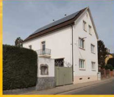
Kalinke Leininger Ring 75