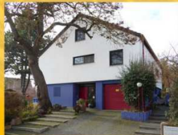
Gartenpark Völker Unterer Graben 7a