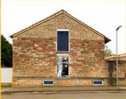
Lucien Chiua Offsteiner Weg 6