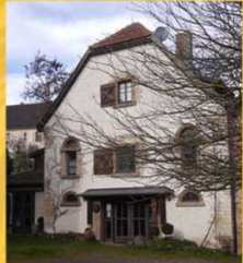
Rudi Muth Schlossweg 7