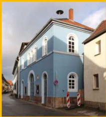
Blaues Rathaus Leininger Ring 62