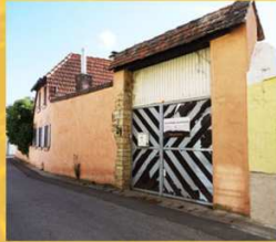
Stockmanufaktur Böshenzstr. 23